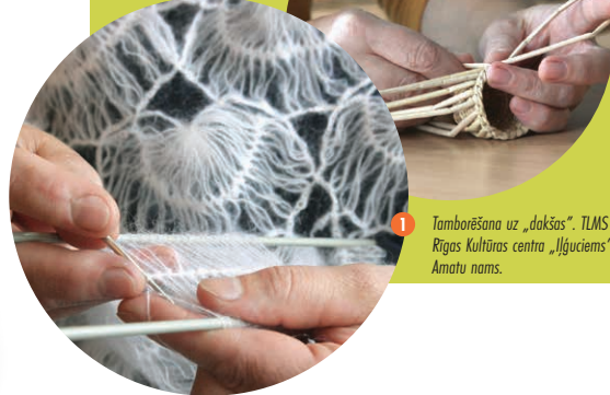
Tamborēšana uz „dakšas”. TLMS „Ritaušas”. Rīgas Kultūras centra „Ilguciems” Amatu nams.