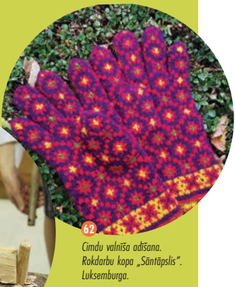
62 Cimdū valniša adīšana. Rokdarbu kopa „Santāpslis”. Luksemburga.