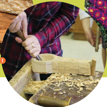
1 Karašu griešana. TLMS „Dzīne”. KTMK „Ritums”. Pārdaugavas mūzikas un mākslas skola.