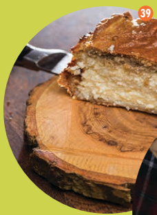
39 Latviešu kulinārais mantojums – šokātis (Metepu plācenis). Sarkaņu Amatu skola. Madonas novads.