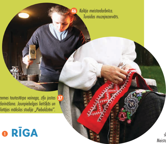
46 Kalēja meistardarbnīca. Turaidas muzejrezervāts.