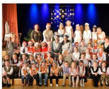
Pōti, pōti, Ziemeļi