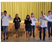
Protu, varu, daru