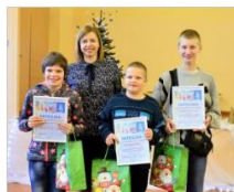
Ziemassvētku atklātņu konkurss