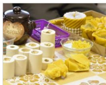
Sveču liešana Višķu dienas aprūpes centrā