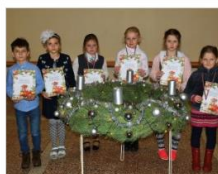
Bērni veidoja savu Ziemassvētku pārsteigumu