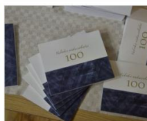
Vaboles vidusskolai 100