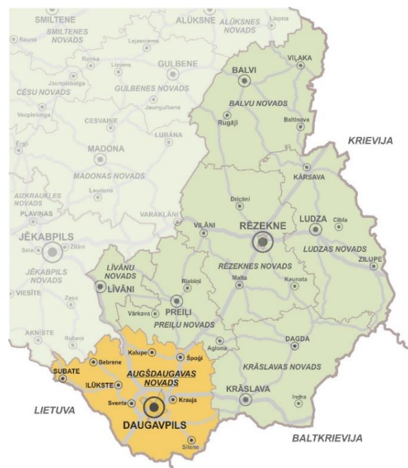
ATTĒLS 3. Daugavpils un Augšdaugavas novada novietojums Latvijā un Latgales plānošanas reģionā