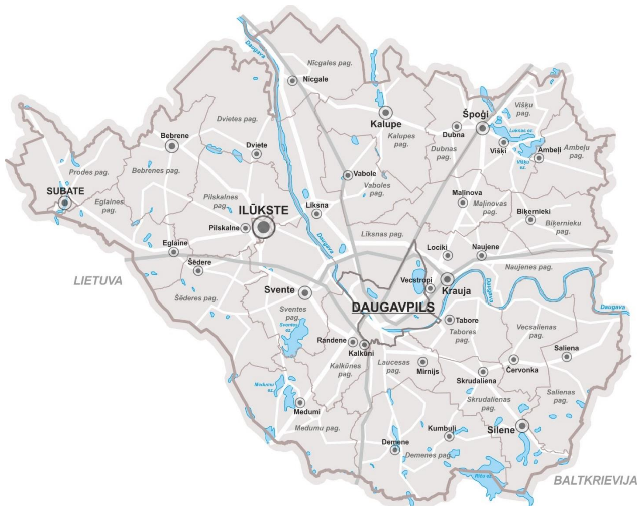
ATTĒLS 2. Daugavpils un Augšdaugavas novada teritorija

novada teritorijas attīstības plānošanas dokumentiem un ir aktualizējams pēc nepieciešamības. Tas raksturo teritorijas attīstības tendences, problēmas un resursus.