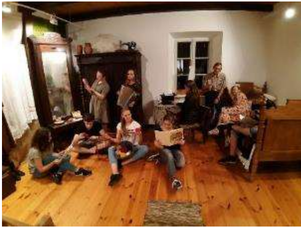
BJTS "Berķeneles kamolītis"