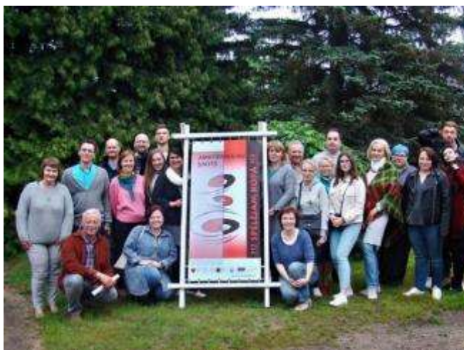
Amatierteātru saieta “Spēlējam kopā” dalībnieki

- Latvijas Republikas proklamēšanas 101. gadadienas svinīgais sarīkojums “Kopīgs ceļš” . Latvijas Republikas proklamēšanas 101. gadadienas svinīgā sarīkojuma "Kopīgs ceļš" tēma bija Baltijas ceļš, kurā pirms 30 gadiem- 1989.gadā Latvijas, Lietuvas, Igaunijas iedzīvotāji, sadodoties rokās, atgādināja pasaulei, ka Maskavā parakstītais Hitlera – Staļina pakts ir sadalījis Eiropu un lēmis trīs neatkarīgas Baltijas valstis PSRS okupācijai. Sarīkojumā piedalījās: tautas deju kolektīvs "Tuurit - Tuurit" no Pērnavas (Igaunija), vidējās paaudzes deju kolektīvs "Ežerunas" no Zarasiem (Lietuva) un Daugavpils novada Kultūras centra “Vārpa” deju ansamblis "Līksme". Koncertā kolektīvi dejoja katrs savas valsts tautas dejas, noslēgumā visu trīs valstu kolektīvi vienojās kopīgā dejā, skanot dziesmai "Atmostas Baltija". Koncerta māksliniecišķā vadītāja Aija Daugele, režisore un scenārija autore Anita Lipska.