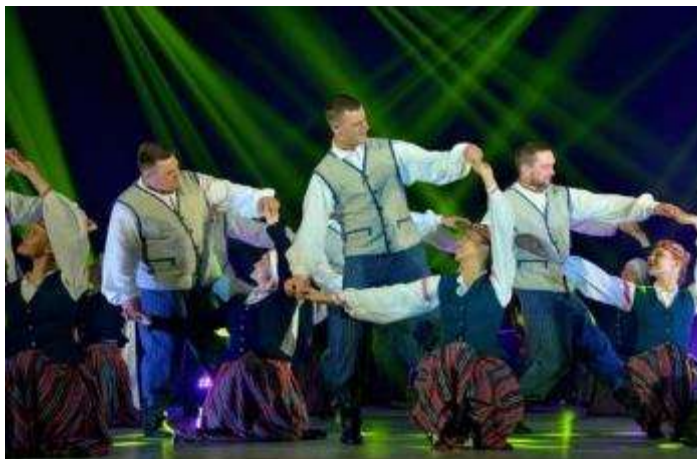
DNKC „Vārpa” deju ansamblis „Liksme” 50 gadu jubilejas koncertā