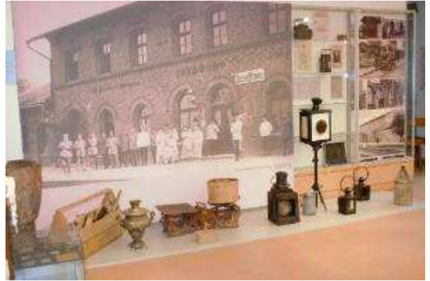
Izstāde "Naujenes pagasta vēsture"