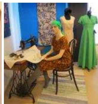
Izstāde "Šūsim pašas"