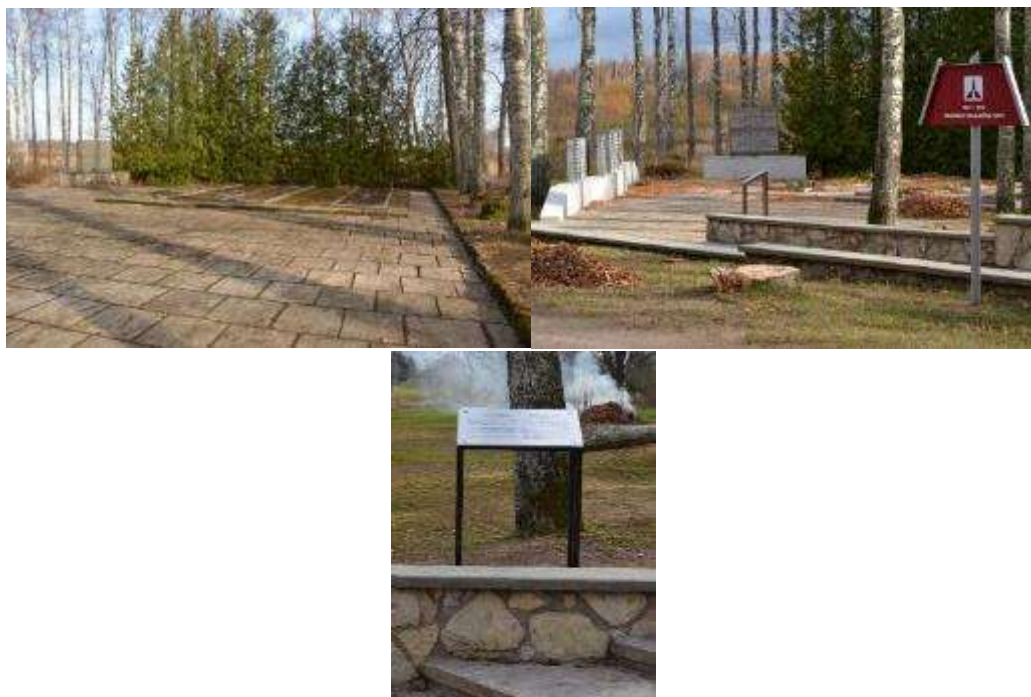
Kalupes Otrā pasaules kara Sarkanās armijas karavīru brāļu kapi pirms un pēc atjaunošanas darbiem.