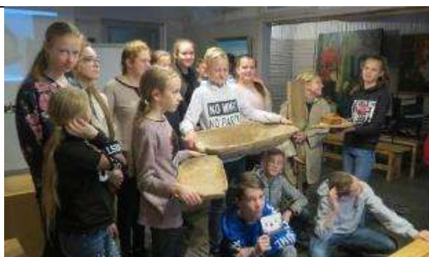
Muzejpedagoģiskās programmas skolēniem