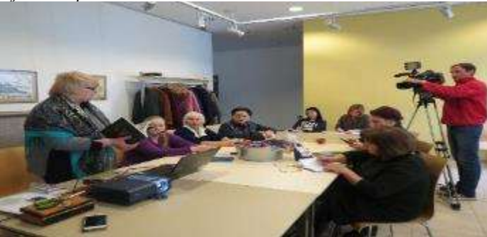
Vecticībnieku jostu višanas un lupatu lellīšu izgatavošanas darbnīcas