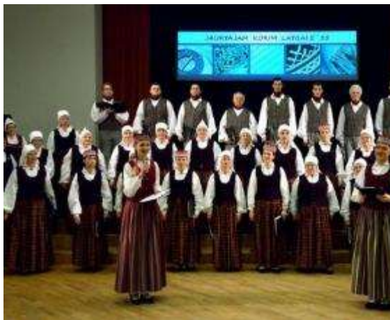
DNKC „Vārpa” jauktais koris „Latgale” 55 gadu jubileja koncertā