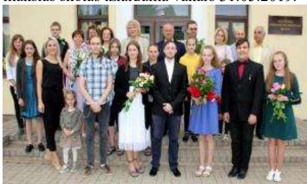
Skolas izlaiduma vakars 31.05.2019