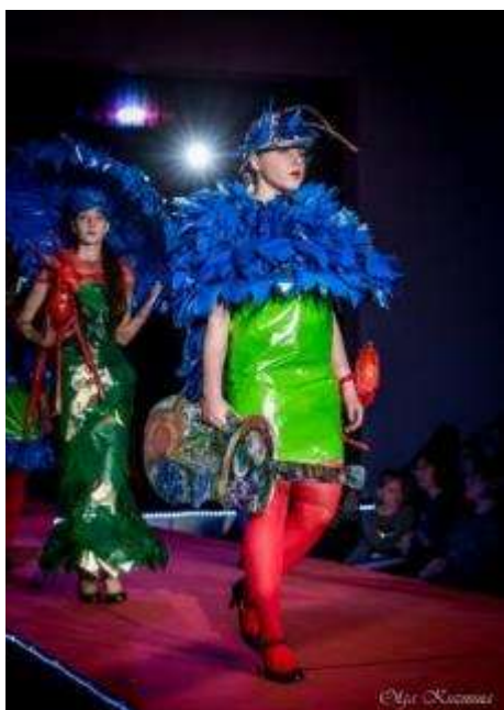
Mākslas konkurss “Priekšmets. Manta. Lieta.”