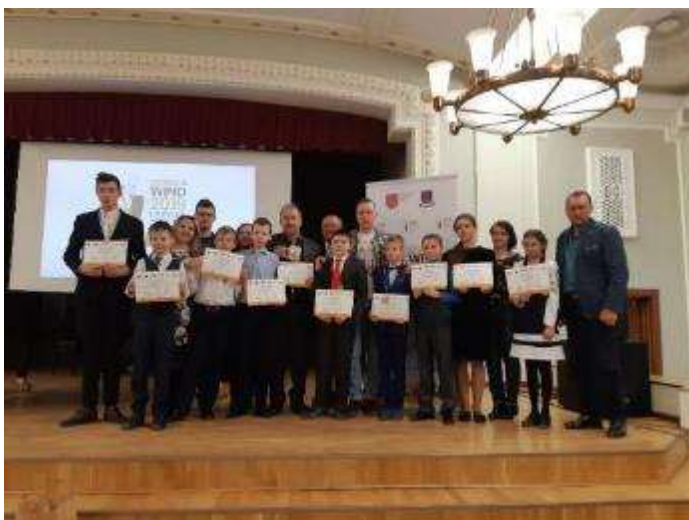
III Starptautiskais pūšaminstrumentu spēles jauno izpildītāju konkurss “Naujene Wind”