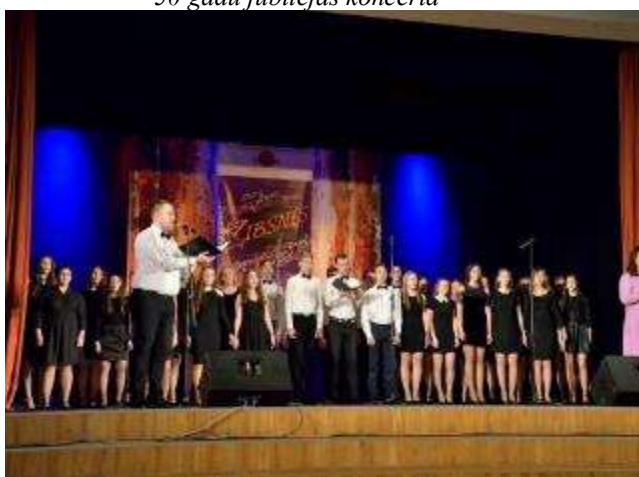
Višķu pagasta jauniešu koris Daugavpils novada talantu konkursā „Zibsnis”