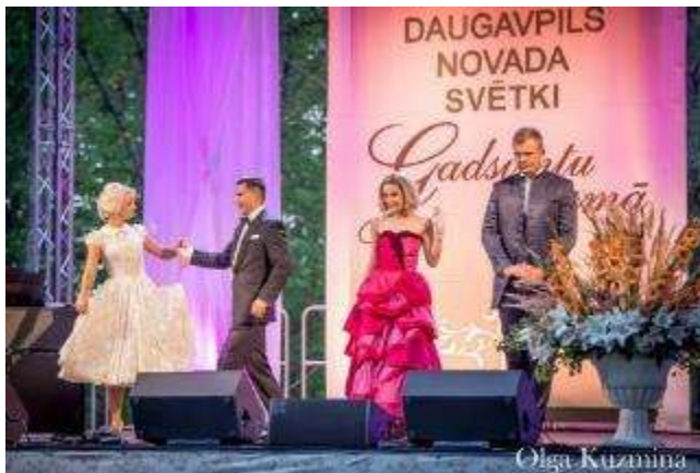
Operetes teātris Daugavpils novada svētki "Gadsimtu gaismā"