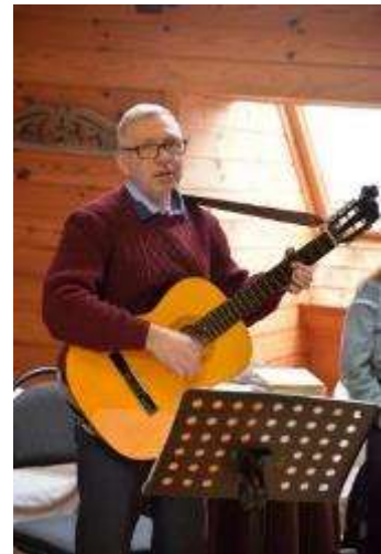
Dzejas pēcpusdiena Raiņa mājā Berķenelē