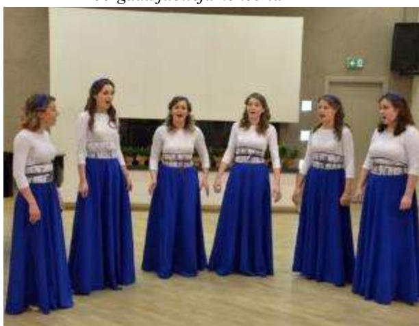
Višķu pagasta sieviešu vokālais ansamblis „Anima Corde” Daugavpils novada skatē