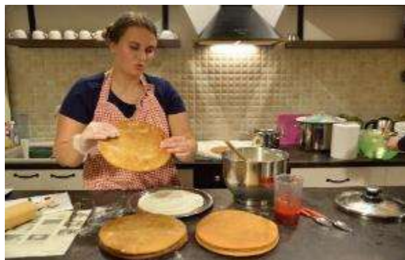
Kūku un toršu pagatavošanas meistardarbnīca

2019.gadā Muzejs piedāvāja 3 muzejpedagoģiskās programmas : Maizes ceļš; Priekšmetu un lietu stāsti; Brāļi Skrindas – gaismas nesēji, kā arī 4 radošās darbnīcas: Izkrāso pats; Grafikas iespieddarbu darbnīca; Jostiņu aušana, pīšana un mezglošana; “Cepu, cepu kukulīti”.