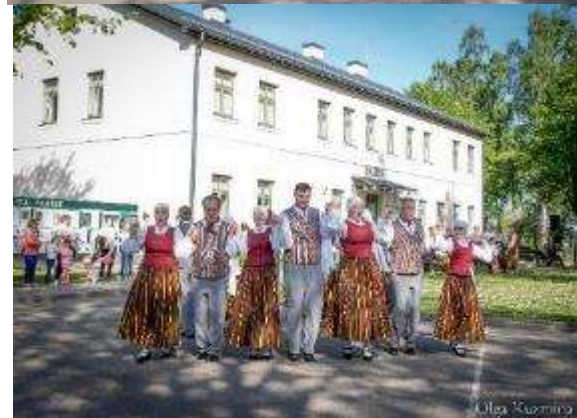
Muzeju nakts pasākums