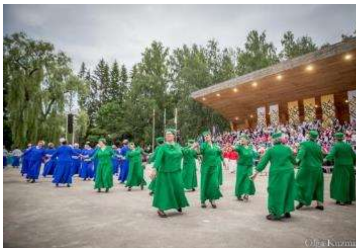
17. Senioru dziesmu un deju festivāls “Saulei pretī mūžu ejot”