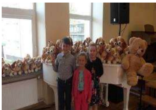
Starptautiskais jauno izpildītāju konkurss “Mazie talanti 2019”, Utena, Lietuva