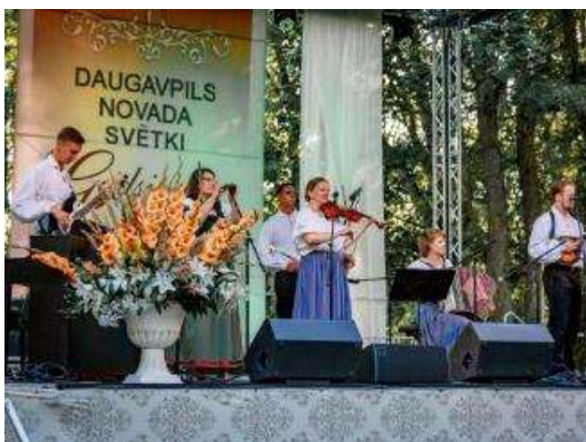
Folkloras kopa “Dyrbyni” Daugavpils novada svētkos “Gadsimtu gaismā”

Teātra studija „Mode H”, kurā darbojas cilvēki ar īpašām vajadzībām no Daugavpils novada, iestudēja teatralizētu uzvedumu pēc Gabriela Garsijas Markesa darba „Pēdējā vēstule pasaulei”, kam pirmizrāde notika martā.