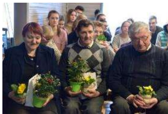
Represēto tikšanās pasākums