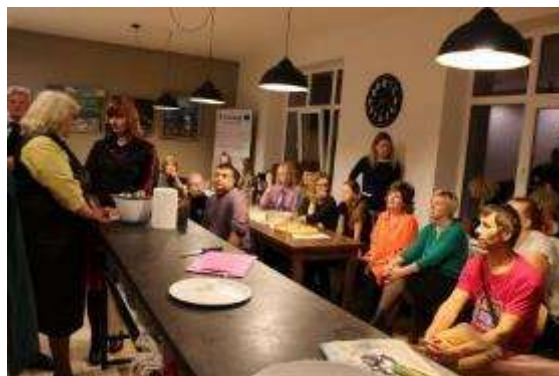
Kulinārā mantojuma telpa Skrindu dzimtas muzejā