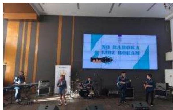
Festivāls – konkurss “No baroka līdz rokam”, Rīga