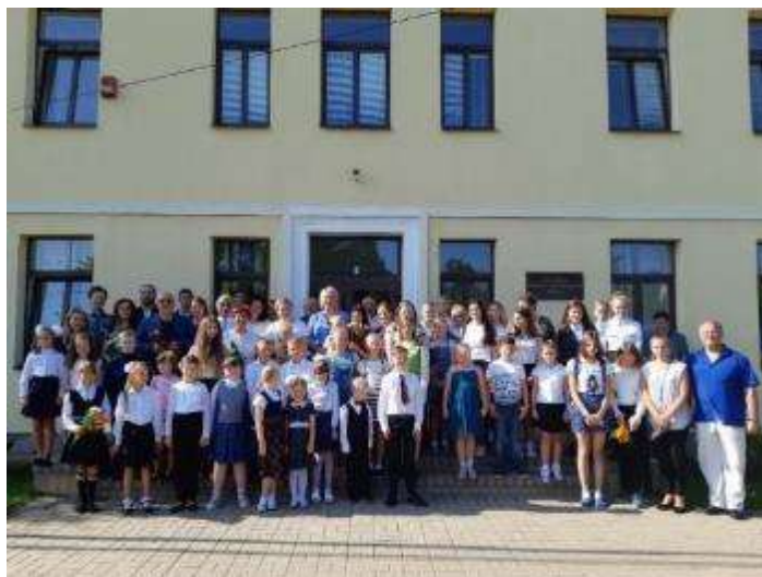
Zinību dienai veltīts pasākums