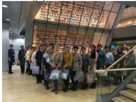
Novada bibliotekāri izbraukuma seminārā Latvijas Nacionālajā bibliotēkā