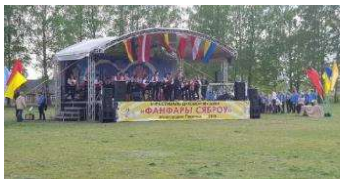
Naujenes pūtēju orķestris VI starptautiskais atklātais pūtēju mūzikas festivālā “Fanfari siabrou” Baltkrievijā.