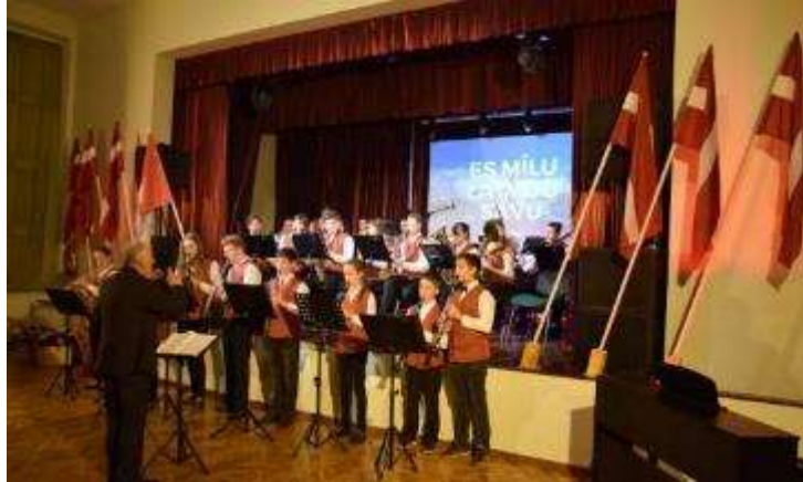
Pūtēju orķestra dalība LR Proklamēšanas gadadienai veltītā svinīgajā pasākumā Višķu pagastā