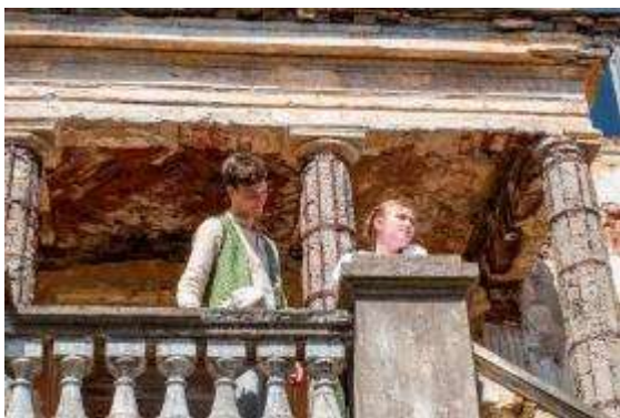
Muzeju nakts–2019 “Nav nosapņots, bet piedzīvots”