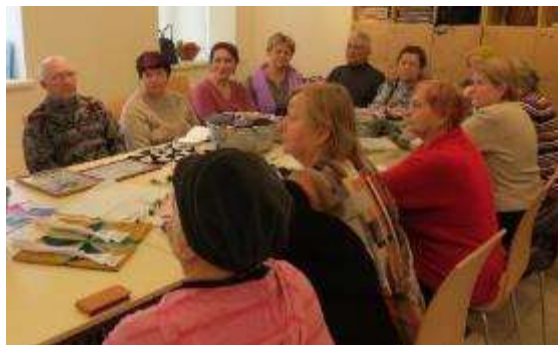
Vecticībnieku šestovkas un lupatu lellišu izgatavošanas darbnīca