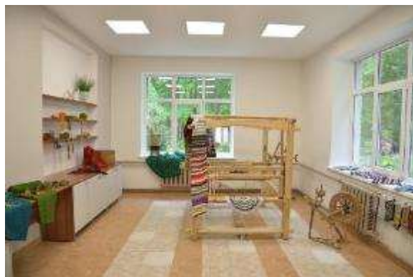
Kulinārā mantojuma telpas atklāšanas pasākums