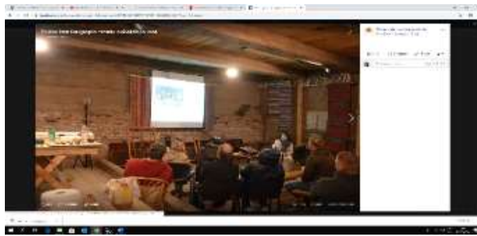
15.09.2019. Eiropas kultūras mantojuma dienu pasākums Raiņa mājā Berķenelē: “Vēsturisko būvgaldniecības izstrādājumu vērtība”