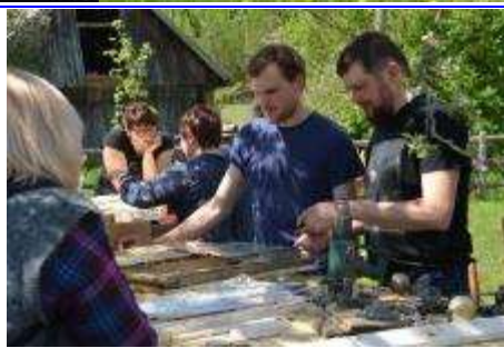
18.05.2019. Meistarklase: “Vēsturisko koka logu atjaunošana un saglabšana”, Slutišķos

2) 15.09.2019. Eiropas kultūras mantojuma dienu pasākums Raiņa mājā Berķenelē: “Vēsturisko būvgaldniecības izstrādājumu vērtība” (pasākuma norisei piesaistīts Latgales kultūras programmas atbalsts):