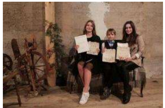
Skatuves runas konkursa“Zelta sietiņš” laureāti