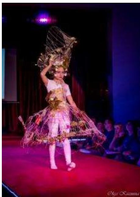
Mākslas konkurss “Priekšmets. Manta. Lieta.”