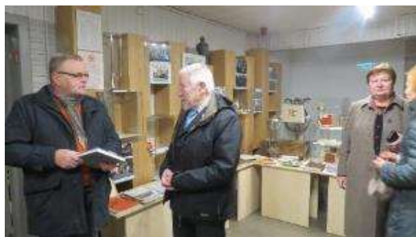
Izstādes “Vaboles vidusskolai 100” atklāšanas pasākums

– Latvijas un Lietuvas pārrobežu projekta Nr. LLI-37 "Zarasu rajona un Daugavpils novada mazākaktīvo teritoriju iedzīvotāju radošuma un uzņēmējdarbības aktivitātes atbalstīšana, izmantojot sociālkultūras pasākumus" ietvaros organizētas septiņas Latviešu tradicionālās virtuves kulinārās meistardarbnīcas , kurās notika ēdienu pagatavošanas demonstrējumi sadarbībā ar vietējām saimniecēm: