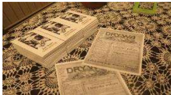
Starptautiskā akcija „Muzeju nakts - 2019”

– Izstādes “Vaboles vidusskolai 100” atklāšana. Izstādē skatāmi materiāli gan no Skrindu dzimtas muzeja krājuma, gan no Vaboles vidusskolas arhīva. Izstādei izveidošanai tika izmantotas arī iedzīvotāju un bijušo skolotāju dažādu laiku liecības un dokumenti. Novadnieks Juris Vanags prezentēja izdoto grāmatu “Dzimtajā pusē”.