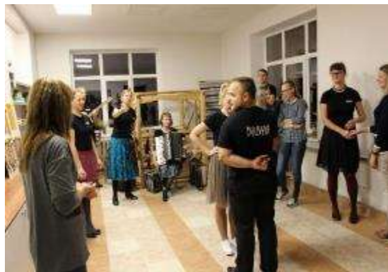
Latgales komu un klimpu pagatavošanas meistardarbnīca