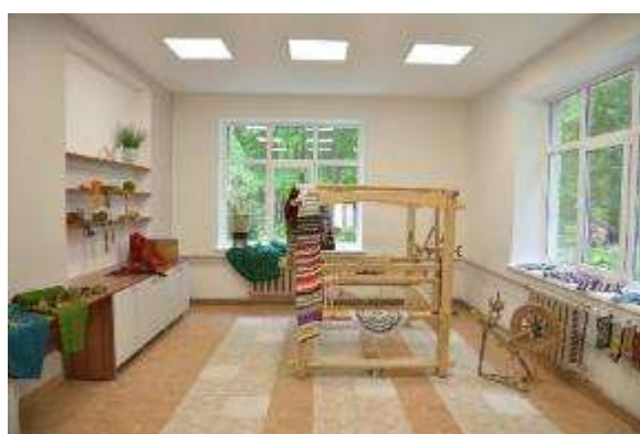
Kulinārā mantojuma telpas atklāšanas pasākums

– Represēto tikšanās pasākums “Atcerēties, lai neaizmirstu”. Pasākuma dalībnieki dalījās atmiņu stāstos par vēsturiskiem notikumiem, noskatījās videofilmu un iepazīnās ar izstādēm muzejā. Pēc pasākuma tā dalībnieki kopā ar muzeja speciālistiem devās izbraukuma ekskursijā, lai iepazītu Dvietes novada kultūrvēsturiskās vietas. Pasākums tika organizēts sadarbībā ar Vaboles pagasta pārvaldi.