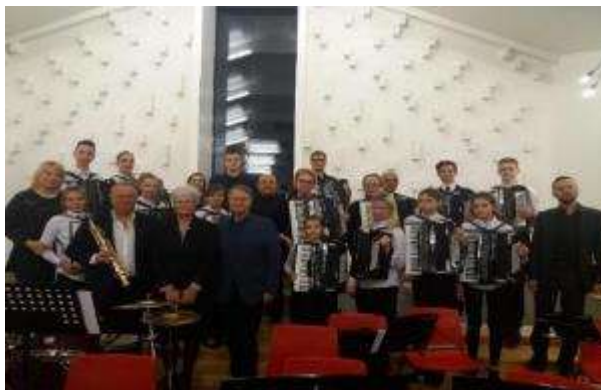
Akordeonistu orķestra koncerts Viimsi pilsētas Mūzikas skolā, Igaunijā