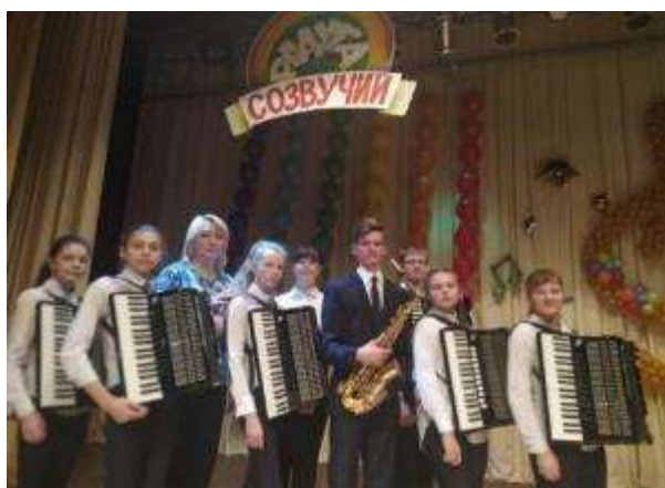
IV starptautiskajā ansambļu mūzikas festivālā “Raduga sozvučij” Šarkovščinā, Baltkrievijā