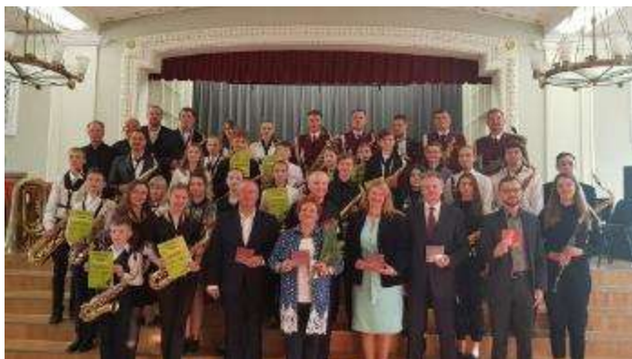
Pasākums “Eiropas saksofona diena Daugavpils novadā”