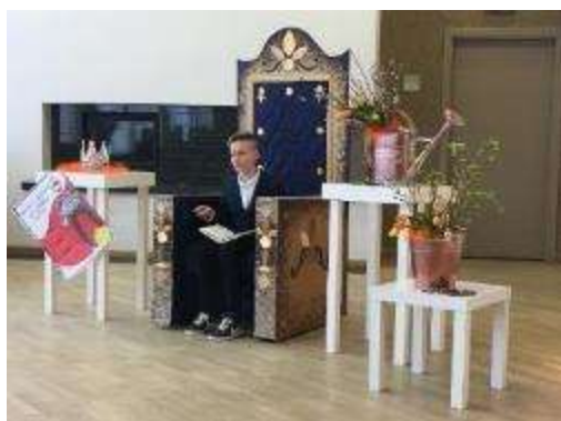
Skaļās lasīšanas sacensību Daugavpils novada fināls