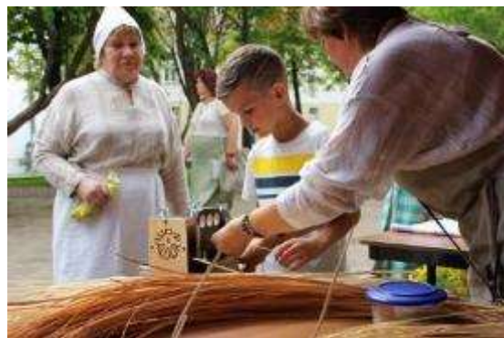
“Amatnieku pilsētiņa” Polockā, 30.08.2019