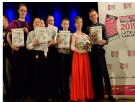
XVI Starptautiskais akordeonistu solistu-konkurss „Naujene”