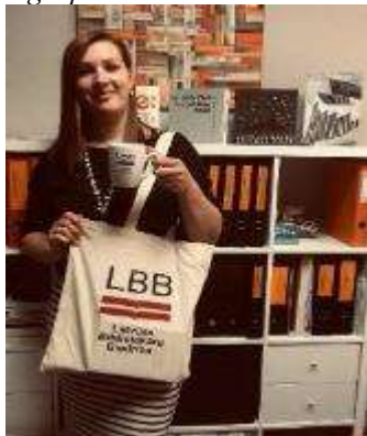
Atzinība par dalību akcijā “Viena diena bibliotēkas dzīvē”