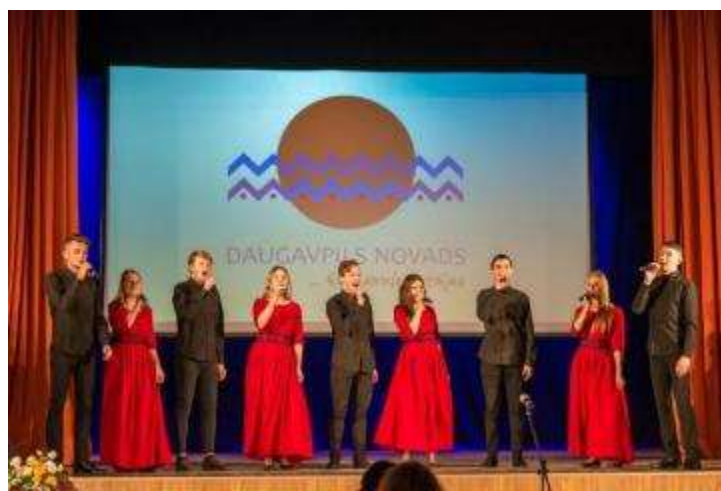
Vokālais ansamblis “Stage On” Daugavpils novada konkursā “Saimnieks 2019”