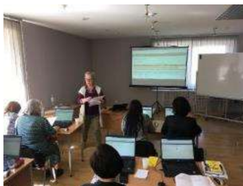
Mācību seminārs darbā ar BIS ALISE