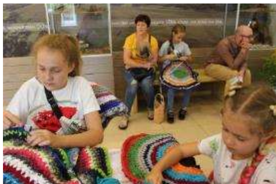
Apaļo tēpiņu tamborēšanas meistarklases naujenes novadpētniecības muzejā, 24.08.2019

vietējā etnogrāfija, muzeju krājumi papildināti ar jauniem eksponātiem, izzinātas un iepazītas 6 mūsdienās aizmirstas senās amatu prasmes.