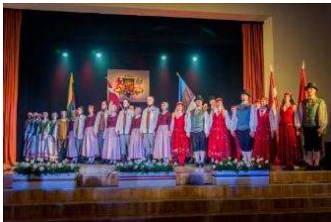
Latvijas Republikas proklamēšanas 101. gadadienas svinīgais sarīkojums "Kopīgs ceļš"