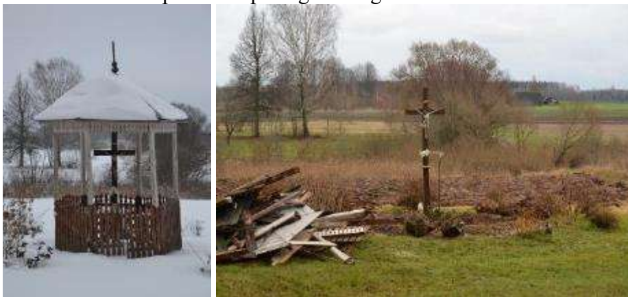
Vaboles pagasta krucifikss “Vabole” pirms atjaunošanas un atjaunošanas procesā.