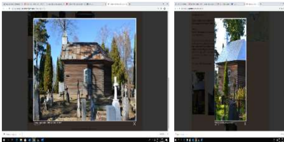
Patmaļu kapliņas jumta stāvoklis pirms un pēc atjaunošanas darbiem.