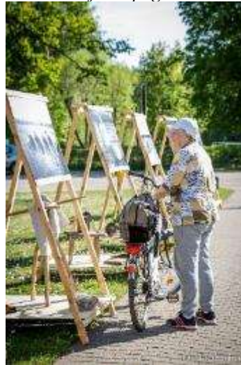
Izstāde "Senās amatu prasmes fotogrāfijās"