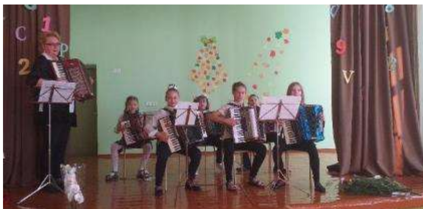
Akordeonistu uzstāšanās "Zinību dienā" Salienas vidusskolā