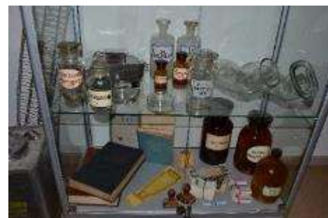
Muzeja vērtīgākie jaunieguvumi