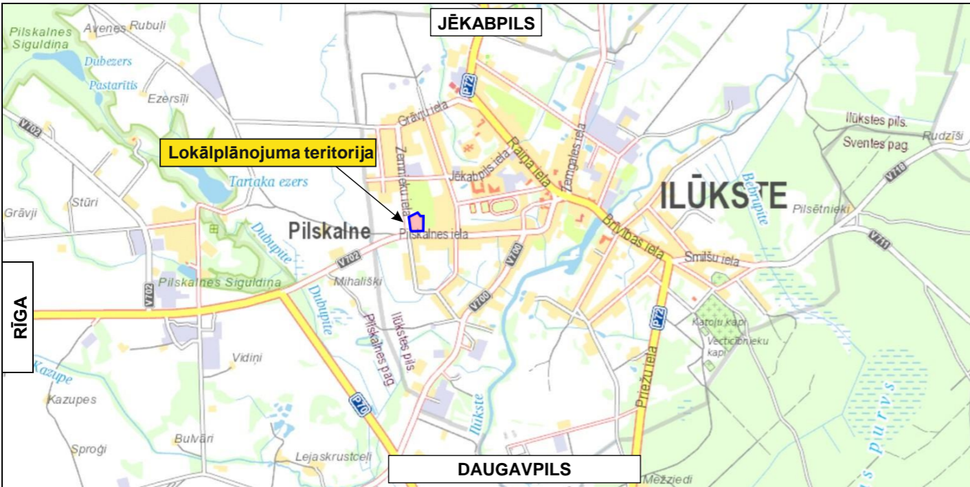
Detālplānojuma teritorijas novietojums (attēls sagatavots izmantojot SIA «Jāņa Sēta» karti)

Kopējā lokālplānojuma teritorijas platība sastāda 0,6251 ha.