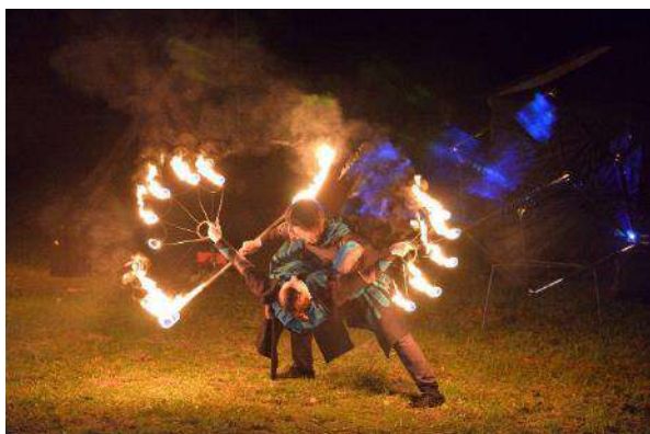
Dzejas dienas 2020