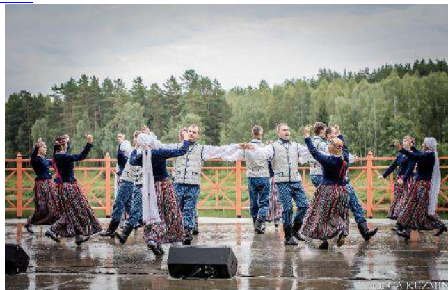
Deju ansamblis „Līksme” koncertā „Pirmoreiz” Slutišķu brīvdabas estrādē