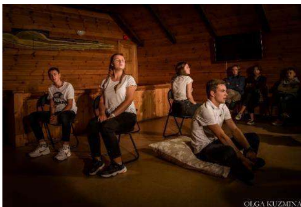
Teātra trupas „Trešais variants” uzvedums „Ziedonis. Epifānijas” Raiņa mājā Berķenelē

Teātra trupa „Trešais variants” iestudēja uzvedumu „Ziedonis. Epifānijas”, kas tika rādīts 11. septembrī Raiņa mājā Berķenelē pasākuma „Dzeja dziedē un spīgo” ietvaros. Teātra trupa iesaistījās DNKC „Vārpa” organizētajās kultūras čempionātu tiešraidēs.