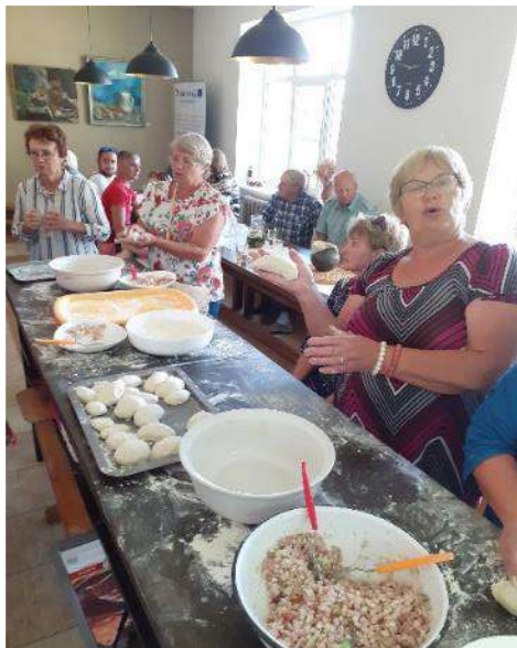
Muzejpedagoģiskā programma “Maizes ceļš” pieaugušajiem