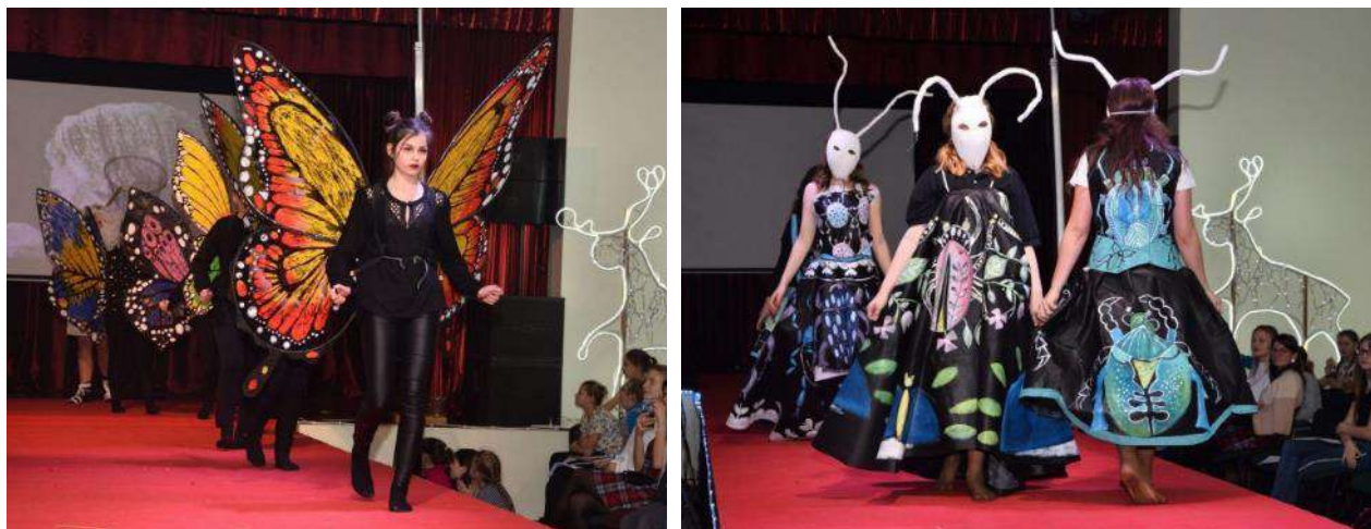
Mākslas konkurss “Flora un fauna”

https://www.daugavpilsnovads.lv/flora-un-fauna-jauniesu-raditajos-terpos/