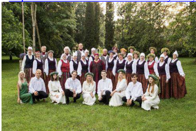
Koris „Latgale” un Vokālais ansamblis „Stage On” Līksnā, ierakstot video

https://www.facebook.com/muzykysskrytuļs/