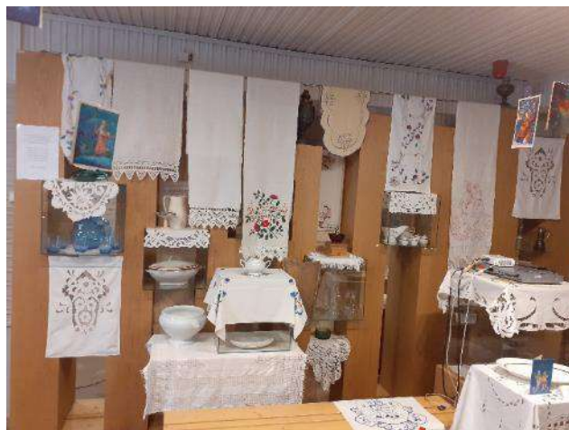
Izstāde "No manas pūralādes"