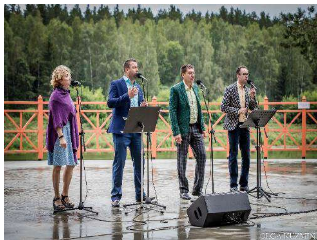
Koncertā „Pirmoreiz” Slutišķu brīvdabas estrādē uzstājas Daugavpils Teātra dziedošie aktieri