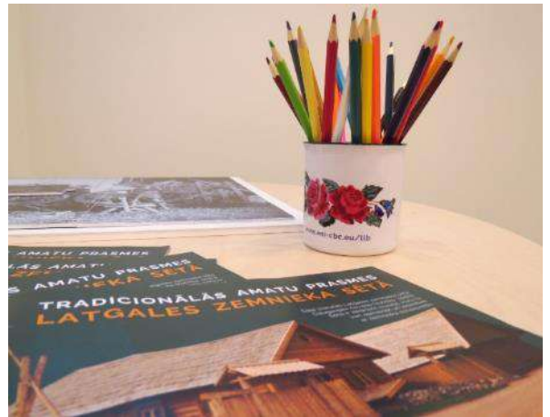
Stūrītis pirmskolas un sākumskolas bērniem