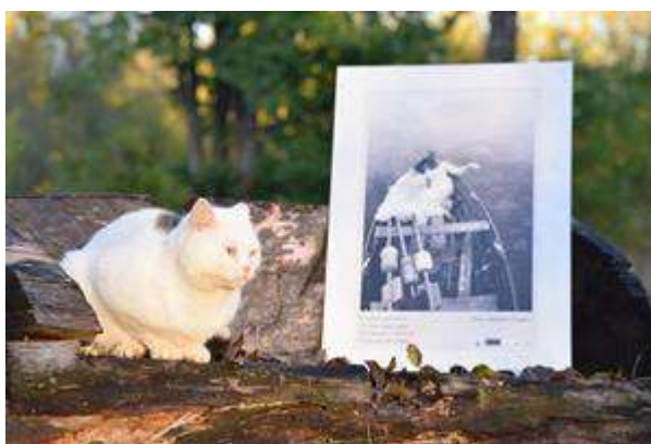
Fotogrāfiju izstāde “Rainis un Berķenele” “Dzīve turpinās..”