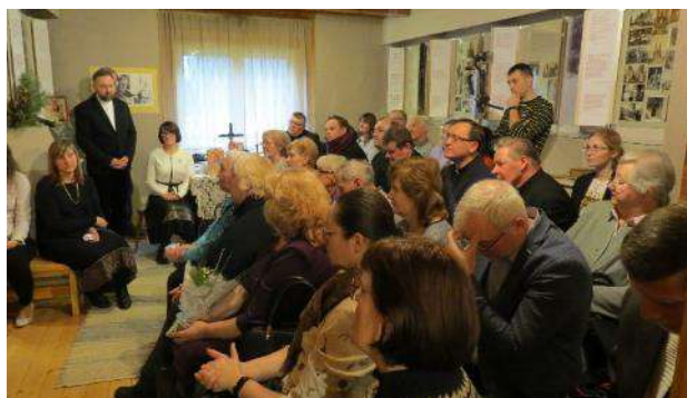
Jāņa Mendriķa dienasgrāmatas atvēršanas svētki