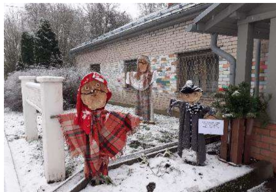
Muzeja darbinieku darinātie ķekatknieki pie muzeja ēkas