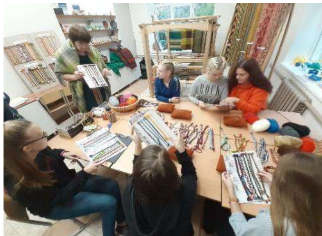
Audējas D. Teivānes nodarbības