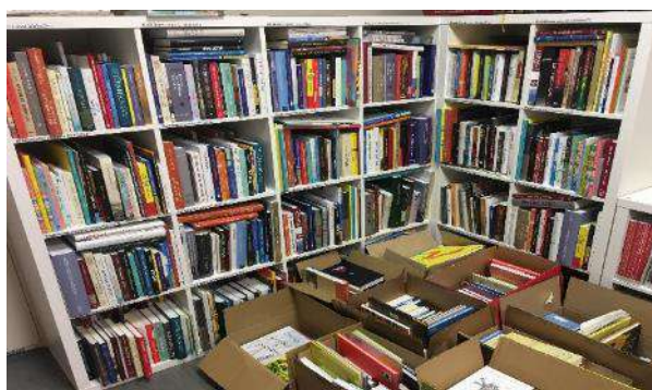
no LNB saņemtā vērtīgā literatūra

https://www.daugavpilsnovads.lv/lasisanas-sacensibas-cempions/