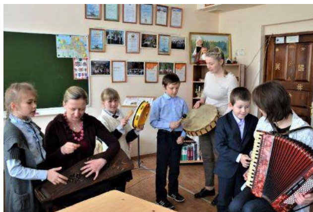
Folkloras kopas „Dyrbyni” pārstāves Latviešu kultūras dienās M. Gorkija (Arhlatviešu) vidusskolā, Baškortstānā