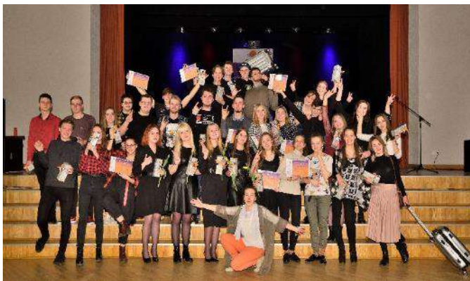
Daugavpils novada talantu konkursa „Zibsnis” dalībnieki