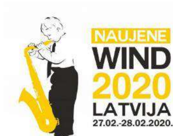
III Starptautiskais pūšaminstrumentu spēles jauno izpildītāju konkurss “Naujene Wind”