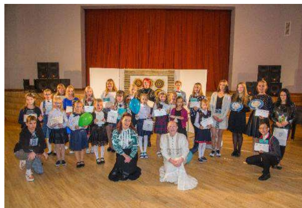
Skatuves runas konkurss