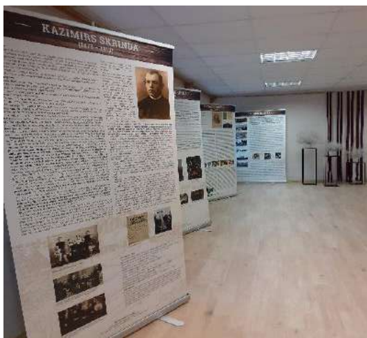
Izstāde "Brāļi Skrindas – Latgales tautas pirmie atmodas darbinieki"