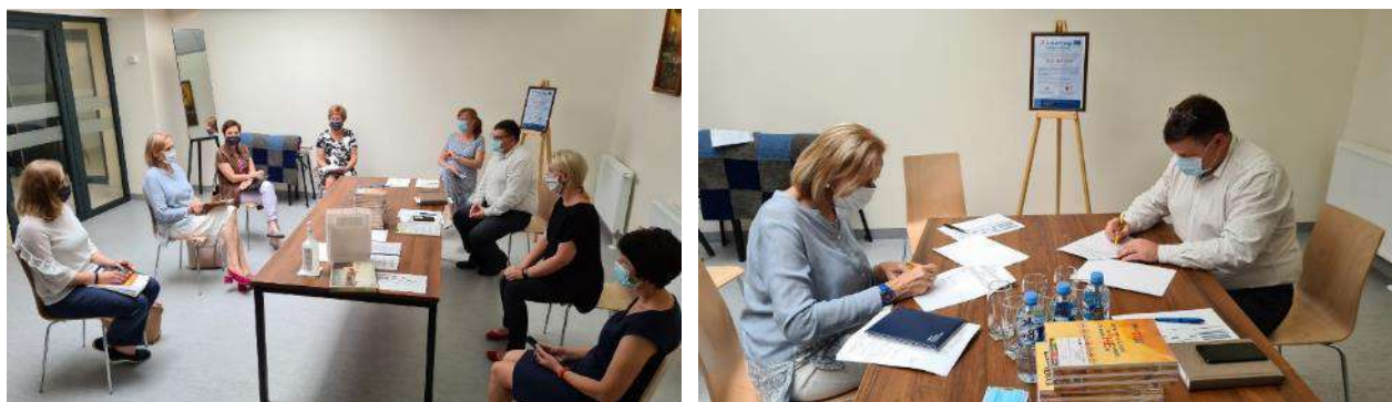
Līguma parakstīšana starp Daugavpils novada Kultūras pārvaldi un Zarasu rajona kultūras centru

2020. gada 24. augustā tika parakstīts partnerības līgums Interreg V-A Latvijas – Lietuvas programmā 2014.–2020. gadam starp Daugavpils novada Kultūras pārvaldi un Zarasu rajona kultūras centru par projekta Nr. LLI-541 “Daugavpils novada un Zarasu rajona lauku kopienu attīstīšana, izmantojot mūžizglītības, kultūras un veselīga dzīvesveida aktivitātes (akronīms “Mūžam jauns”) uzsākšanu. Projekta mērķis ir attīstīt Daugavpils novada un Zarasu rajona lauku kopienas, izmantojot mūžizglītības, kultūras un veselīga dzīvesveida aktivitātes. Projekta aktivitāšu ieviešanu būtiski ietekmēja epidemioloģiskā situācija valstī, kā arī ārkārtas situācijas ieviešana, tāpēc tiek meklēti alternatīvi risinājumi darbībām, kuras var veikt attālināti, jo daudzas aktivitātes nevar pielāgot esošajai situācijai. Projekta ieviešana turpināsies līdz 2022. gada februārim.