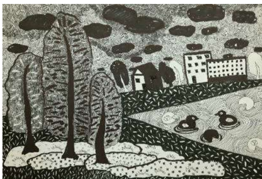
Sintija Derjabo “Melnbalta ainava”