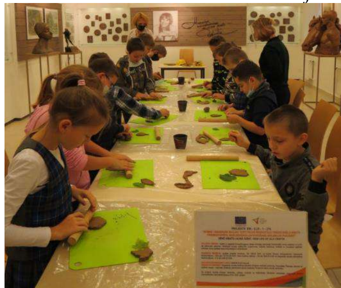
Muzejpedagoģiskā programma skolēniem „Tradicionālās amatu prasmes Latgales zemnieku sētā”