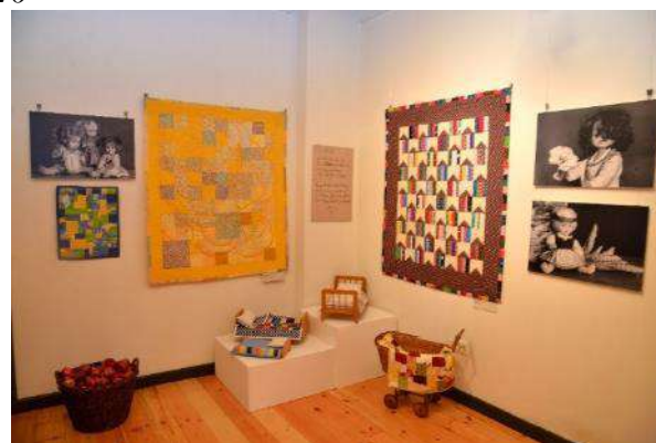
Izstāde “Saldus sapņus Lolītei”