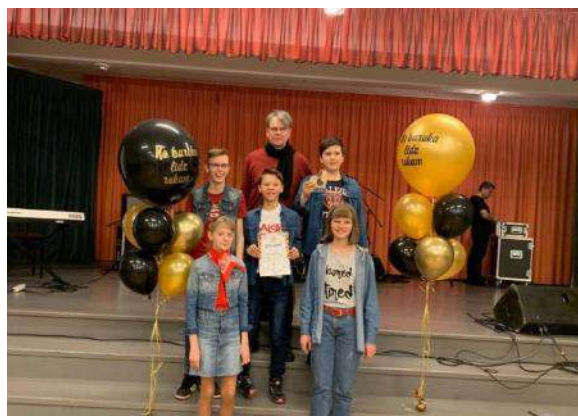
Konkurss “No baroka līdz rokam” Latgales novadu kārtā, Rēzekne