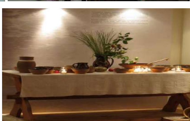
Izstādes „Podniecības tradīcijas Daugavpils novadā” atklāšanas pasākums 13.09.2020.