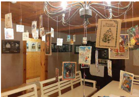
Ziemassvētku atklātņu un eglīšu rotājumu izstāde