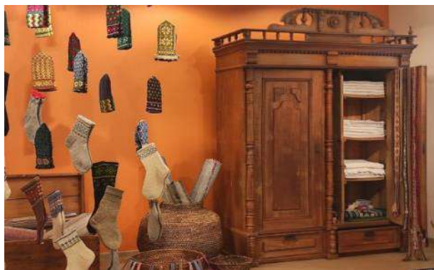
Muzejpedagoģiskās programmas norise izstādē „Rokdarbu tradīcijas Daugavas ielejas teritorijā”

2020. gada tika apgūta jauna pieredze komunicēt ar muzeja apmeklētājiem attālināti un interneta platformā www.artsteps.com izveidota Ziemassvētku un Jaungada atklātņu virtuālā izstāde no muzeja krājuma, skatāma: