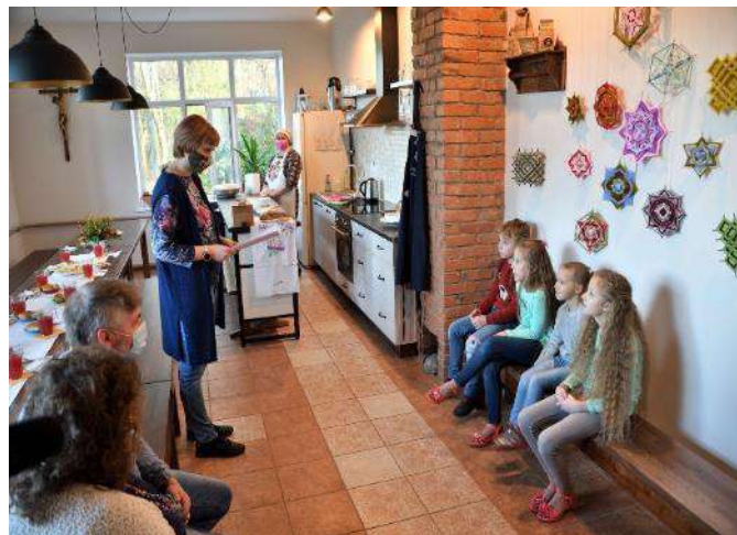
Muzejpedagoģiskā programma “Vakariešona munā sāta” skolēnu grupai