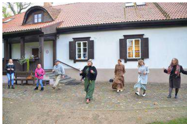
Sezonas noslēguma pasākums