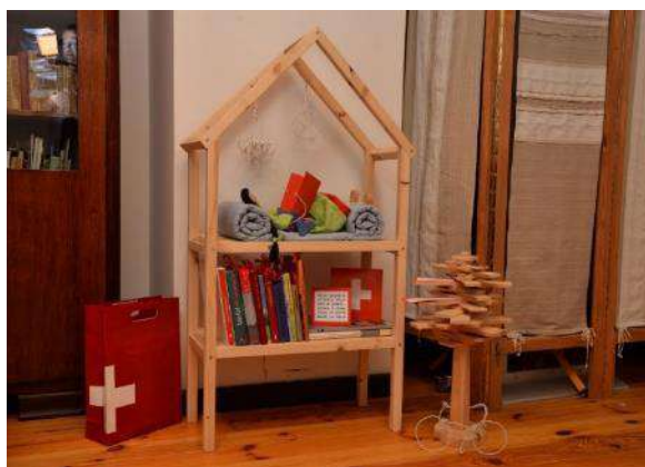
Izstāde “Māja grāmatā un grāmata mājā” “Zelta sietiņš -2020”