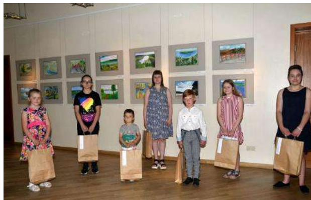
Bērnu vizuālās mākslas izstādes „Augšdaugava” atklāšana

Novembrī Latvijas patriotiskās nedēļas ietvaros tika rīkota akcija , aicinot svinēt svētkus kopā virtuāli. Daugavpils novada Kultūras centra „Vārpa” facebook profila sekotāji, apmeklētāji, kolektīvu dalībnieki tika aicināti dziedāt, dejot, zīmēt, muzicēt, rakstīt novēlējumus vai dzeju, tad to nofotografēt vai nofilmēt un ievietot savā facebook profilā, pievienojot divus tēmturus #Latvijai102 un #VārpaMīlLatviju . Kā arī tika nofilmēts Latvijas Republikas Proklamēšanas 102. gadadienai veltīts apsveikuma video.