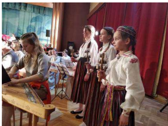
Vidzemes un Dienvidlatgales reģionu kokļu mūzikas koncertā