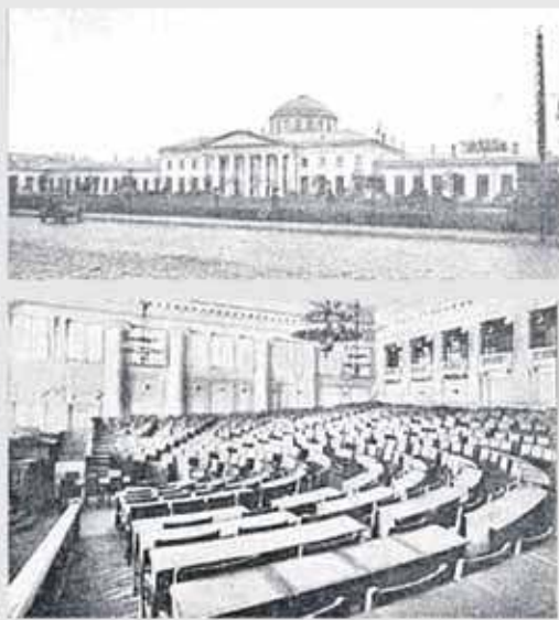
Taurijas pils - Valsts Domes sapulču norises vieta. Pils ēka un skats uz sapulču zāli