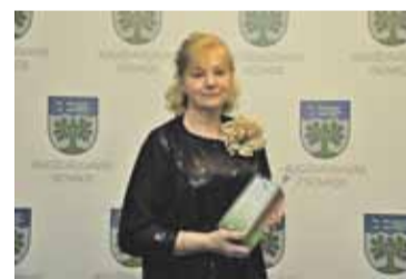
Visa dzīve veltīta sportam un skolēnu trenēšanai – 10. lpp.