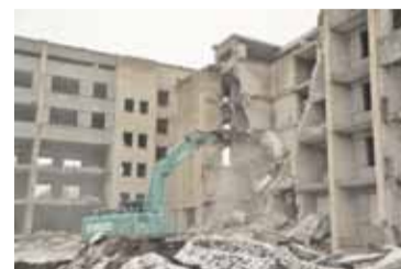
Pašvaldība sāk cīņu ar graustiem – 4. lpp.

brīvā cīņa, Naujenes pagasts. Latvijas U -15 čempions svara kategorijā līdz 68 kg.