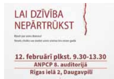
Aicinām piedalīties donoru dienā – 20. lpp.