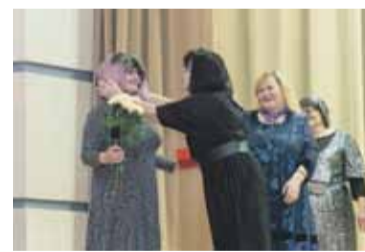
Ilūkstes amatierteātrim "Tādi esam" – 35 – 12. lpp.