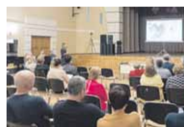
Kā plāno attīstīt Jezuītu klosteri Ilūkstē? – 5. lpp.